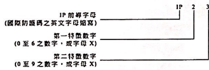
圖 3 IP 碼標示示意圖